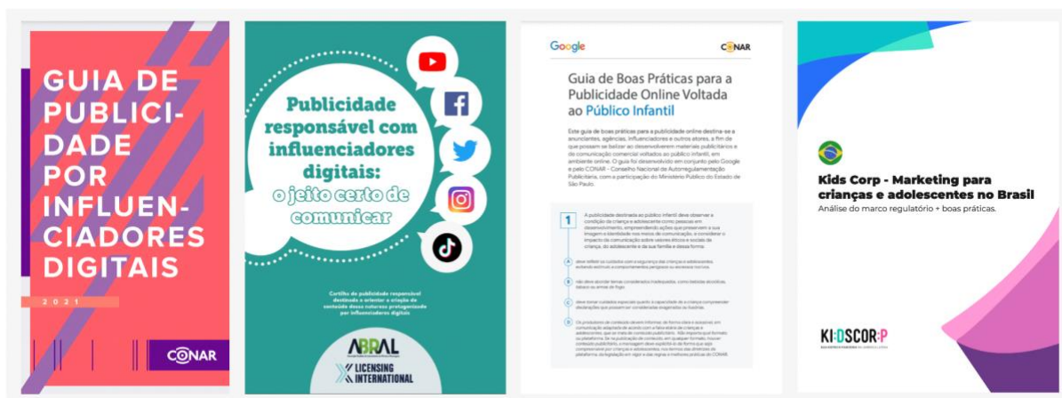
Figura 1 – Dispositivos de proteção anunciados pelo mercado