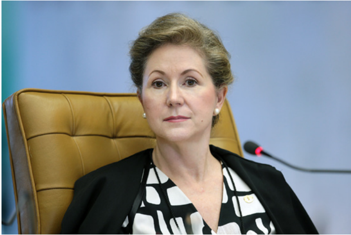
Ministra Ellen Gracie