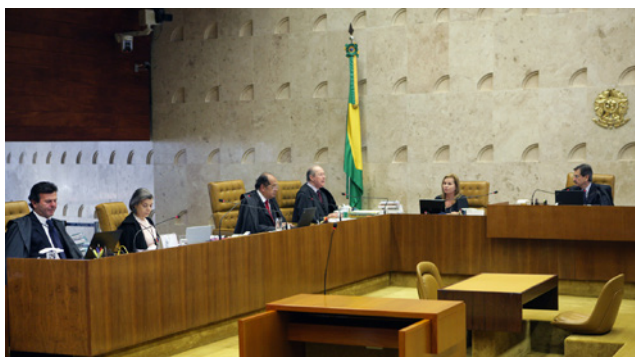
Sessão plenária em homenagem à aposentadoria da Ministra Ellen Gracie.